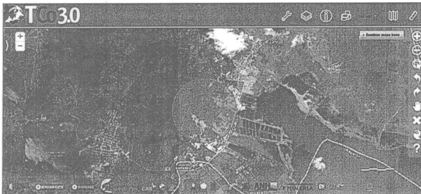
Foto 2. Área consultada en el sistema de alertas temprana Tremarctos v. 3.0. El polígono en azul indica el área consultada correspondiente a la zona muestreada. Arriba: El área buffer corresponde a un radio de 1 km.

El volumen total y comercial inventariado fue de 29,291 m 3 y 7,663 m 3 respectivamente. Hay que recordar que el volumen total incluye el volumen del fuste más el volumen de las ramas (Individuos multifurcados), las especies con mayor volumen inventariado fueron Astronium graveolens y Platymiscium pinnatum , estas especies representan el 50,72 % del volumen de fuste o comercial.